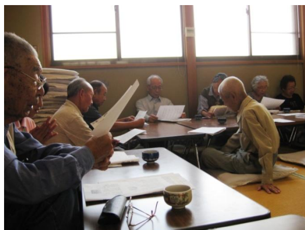
三春会（三春台町内会館）