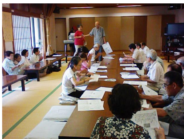
ちとせ会（南センター）