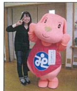
永田支え合い祭り

南区社協のマスコットキャラクター「トモニー」の着ぐるみで南区社協および福祉保健活動拠点の事業や行事で出動し、親しみやすいキャラクターで南区社協の周知をはかりました。