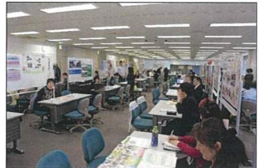
ふくしの仕事フェア