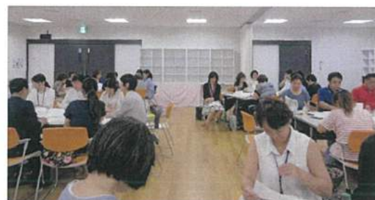
子育てもっとネット会議

「子育てもっとネット～子育てに関わる支援者の情報交換会～」への参加や、子育て支援を行なっている市民団体（南区地域子育て支援拠点はぐはぐの樹など）との連携等、子育て関係団体とのネットワーク作りに取り組みました。