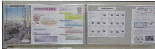
南なんデーにおける広報活動