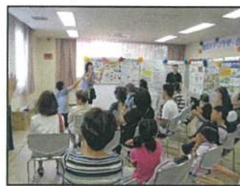
「南なんデー」における地域ケアプラザの周知