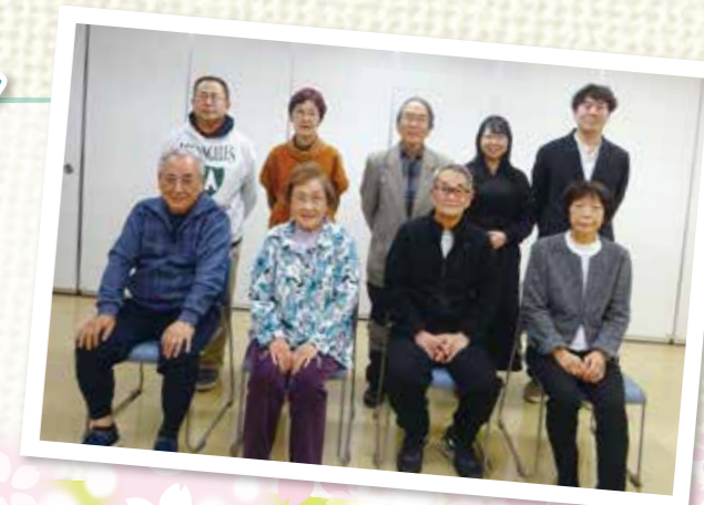
別所地区社協 役員のみなさま