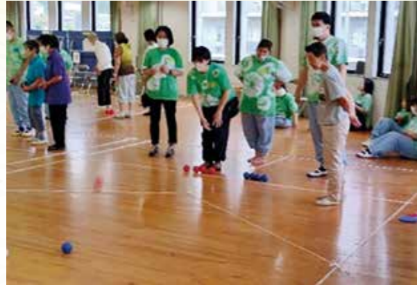
ラフォーレさくら ボッチャ交流会