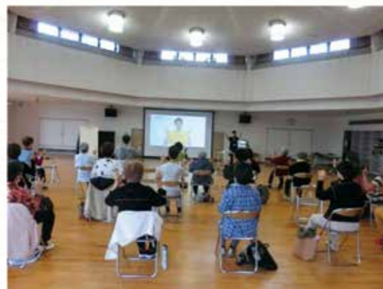
いきいき脳トレ 健康体操