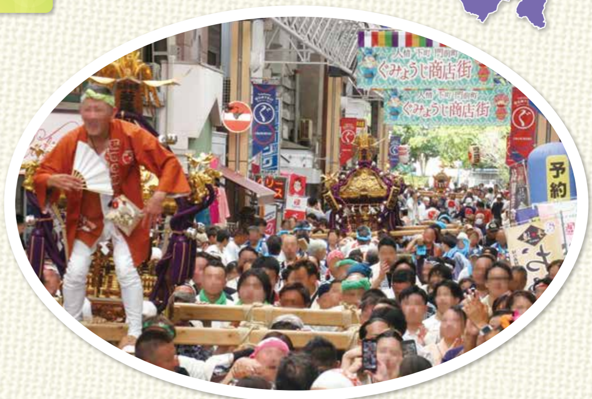
～弘明寺商店街～ 本大岡の五力町連合渡御