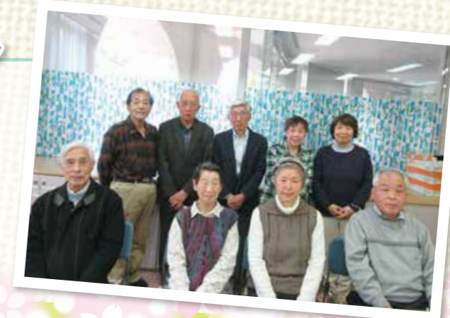
本大岡地区社協 役員のみなさま