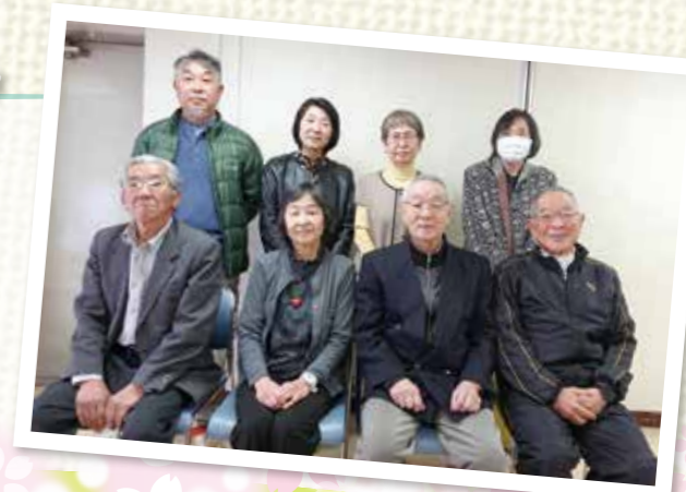
井土ヶ谷地区社協 役員のみなさま