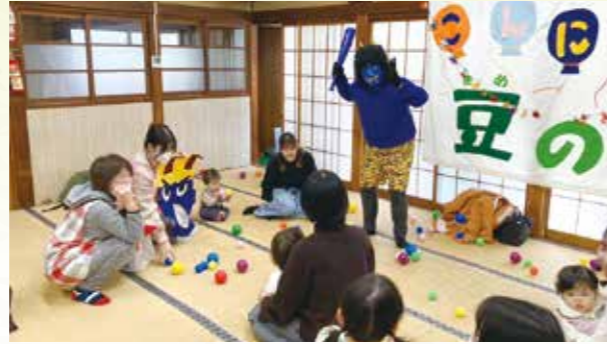
子育てサロン～豆の木～