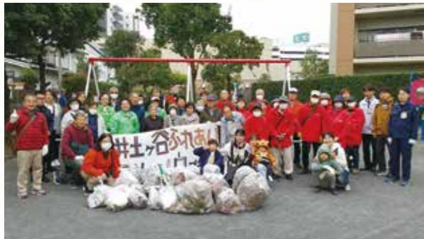
オール井土ヶ谷ふれあいクリーン&ウォーク