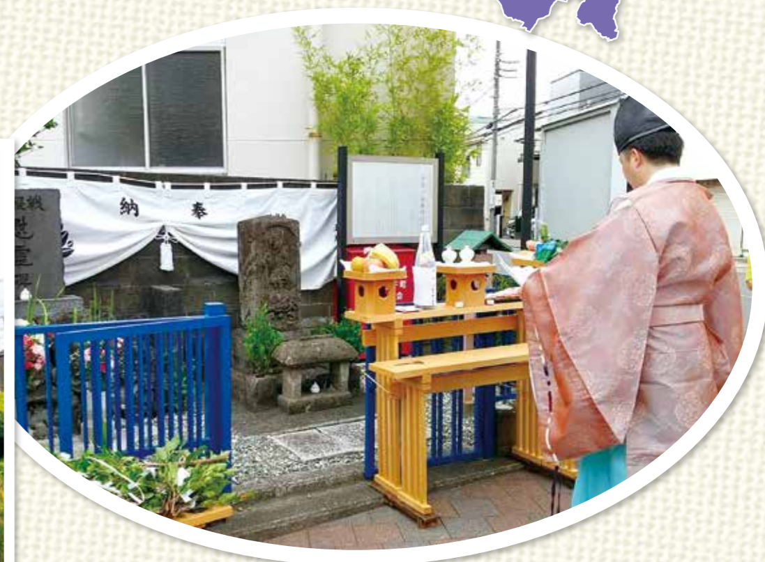
1月・5月・9月の庚申祭の様子