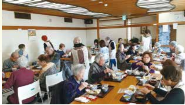
高齢者食事会～カトレア会～