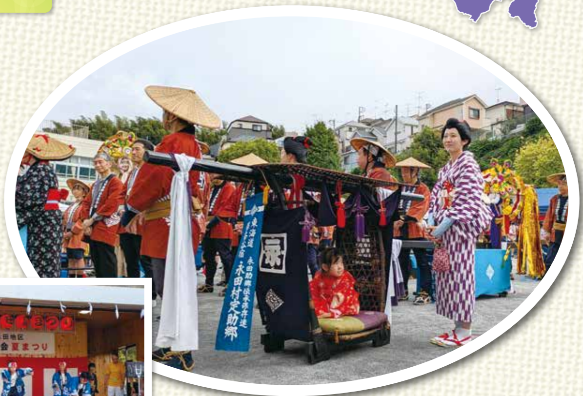
ふるさとふれあいまつり(江戸時代風助郷行列)