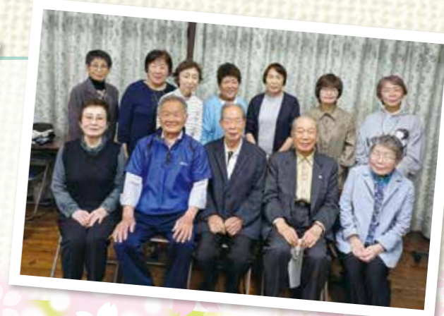
北永田地区社協 役員のみなさま