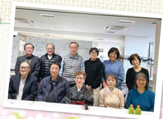
寿東部地区社協 役員のみなさま