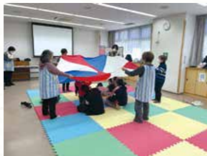
子育てサロン サンサンデイ