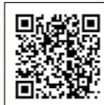
寿東部地区ホームページ

※本会館には、「寿東部地区社会福祉協議会」のホームページがあります。ここでは、連合町内会からのお知らせ、各町内会・自治会のイベントなどを発信しています。