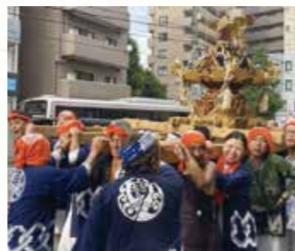
多国籍の方も楽しく参加!!