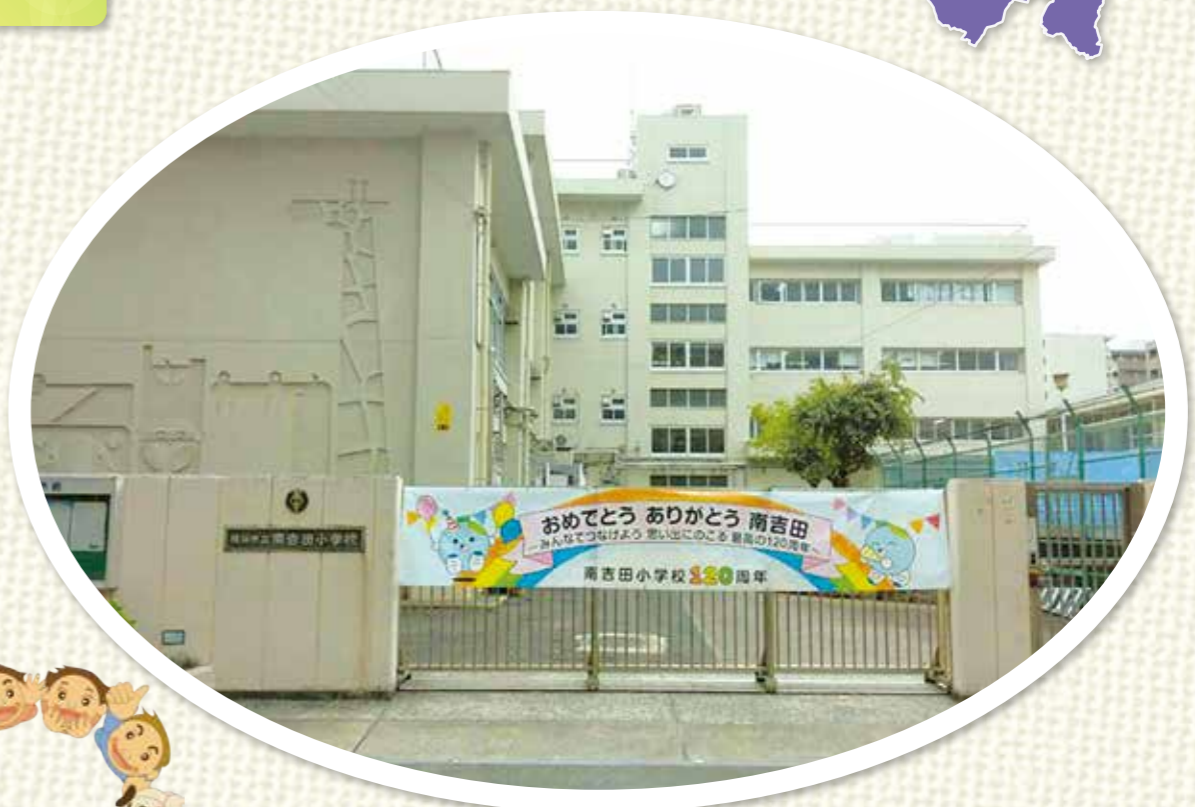
創立120周年を迎えた南吉田小学校