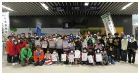
つながり清掃ウオーク