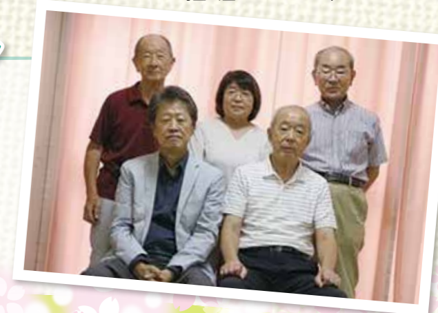
蒔田地区社協 広報委員のみなさま