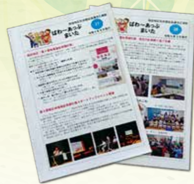
広報紙「ぱわ〜あっぷまいた」