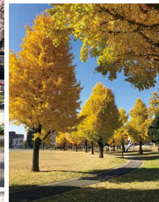
蒔田公園のイチョウ並木