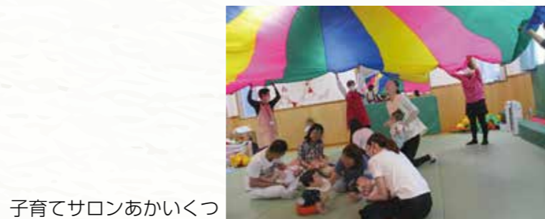
子育てサロンあかいくつ