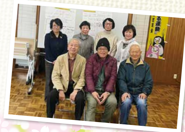
六ツ川大池地区社協 役員のみなさま