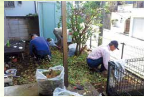
支えあいグループすみれ