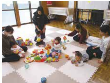
サロン「すくすくひよっこ」

サロン活動や地域の イベントを通じて、 誰もが参加しやすい 活動の場づくりを行います。