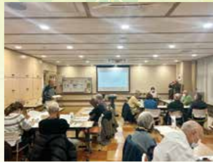
なかむらアカデミア