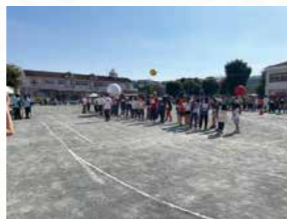
中村地区大運動会