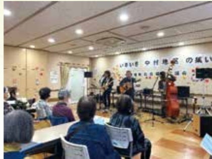
いきいき中村地区の集い

身近な地域で気軽にあいさつ・声かけ合い、小さな単位でのサロンやイベント等を通じて、お互いの顔の見える関係づくりを進めます。