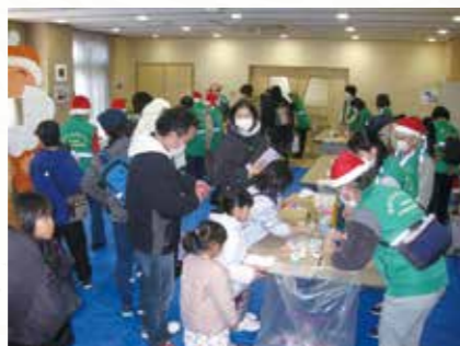
クリスマスフェスタ

伝統・文化(したまち・にんじょう)を大切に、障害や国籍などの垣根なく、世代間交流や隣近所の交流、町内会や施設などの枠も超えて、誰もが参加・活躍できる取組を進めていきます。