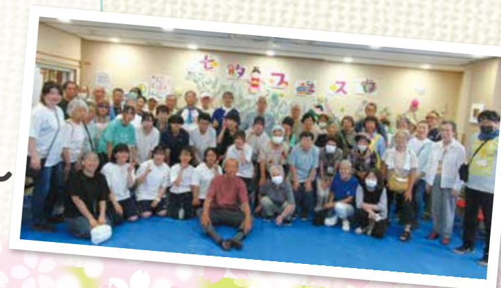
中村地区社協のみなさま