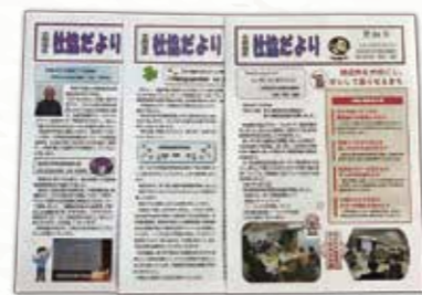
広報紙「社協だより」

大岡地区の魅力として、 特に「 活動 」や「 人 」の情報を発信し、 まちへの 関心や地域活動への参加意欲を高める 情報発信の方法を考えていきます。