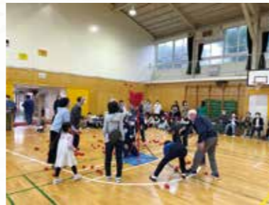
大岡健康福祉まつり