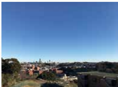
★マークミュー上大岡自治会内の高台からみた風景