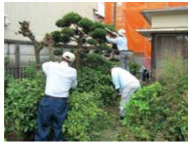
大岡ふれあいサポート

住民一人ひとりが 役割や生きがい を持って、 地域活動に関わるきっかけを 考えていきます。 活動の担い手づくり を進めていきます。