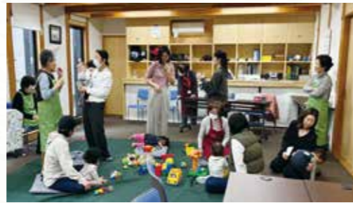
子育てサロンほっぺ

身近な公園や会館等を活用し、 日頃から多世代でつながりあえる 活動の場づくり を行い、 仲間づくりや交流 を進めます。