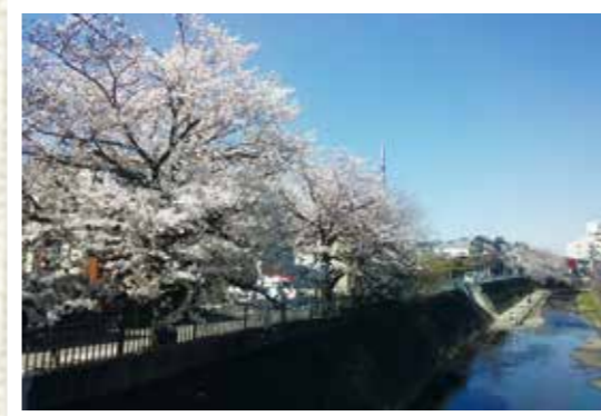
花見橋から見た桜