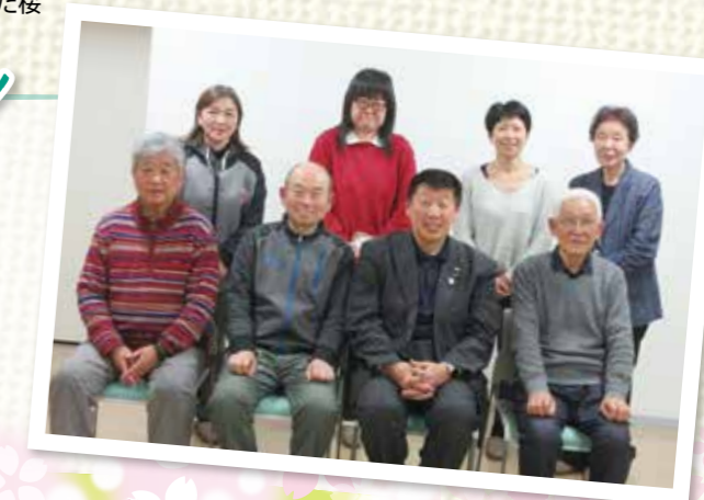
大岡地区社協 役員のみなさま