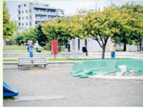
大岡公園ラジオ体操

日常的な見守りや ご近所同士のつながるきっかけとして、 挨拶や声かけ を地域全体で行い、 顔見知りの関係づくり を進めます。