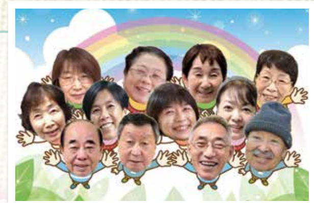
太田地区社協 役員のみなさま