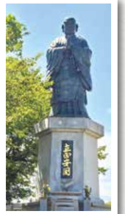
常照寺 日蓮聖人大銅像