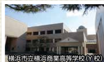
横浜市立横浜商業高等学校(Y校)