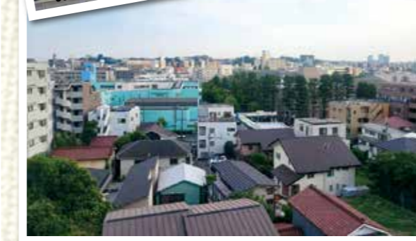
神奈川県立横浜清陵高等学校