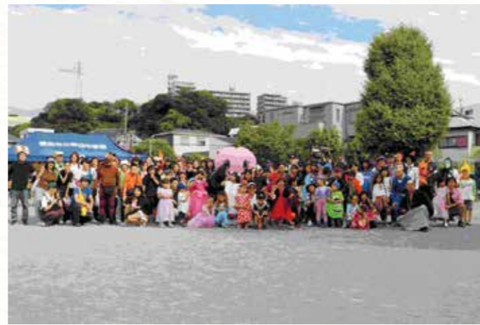
太田地区連合祭り 集合写真

高齢者サロンや子育てサロンなど対象者を募った居場所づくりや、誰もが参加できるハロウィンウォーキングなどの健康づくり活動を通じて、少人数でも大勢でも気軽に交流できる取り組みを行います。また、参加者だけでなく担い手も大いに楽しめる活動ができる企画運営を行います。