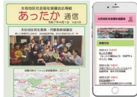
広報紙 (あったか通信)