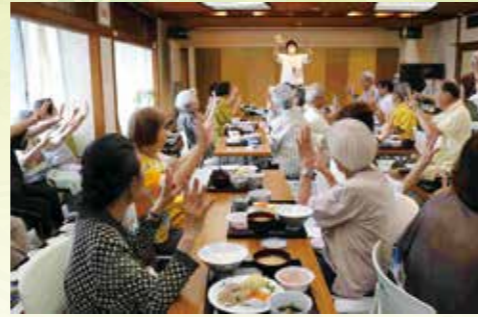
高齢者食事会 ちとせ会