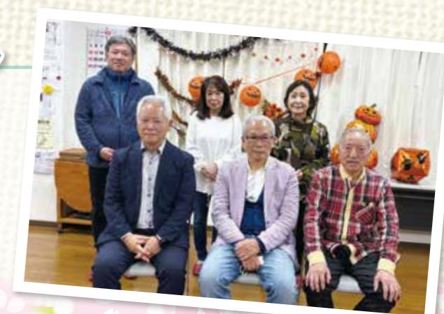
太田東部地区社協 役員のみなさま