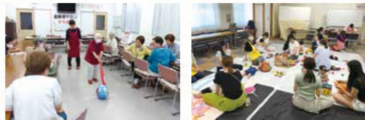
高齢者サロン ひだまり

各サロンやイベントの開催、地域防災拠点訓練、防犯パトロール、認知症サポーター養成協力者を通じて、安心して楽しく住み続ける地域を目指していきます。