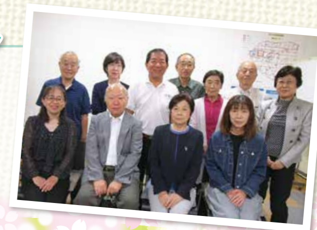
お三の宮地区社協 役員のみなさま