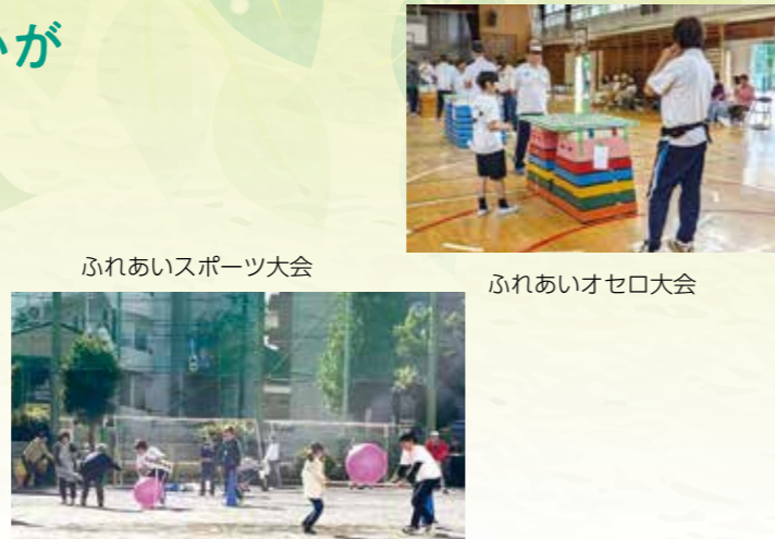
ふれあいスポーツ大会

サロンやイベント、異世代交流事業などの住民とのつながりづくりの場を継続し、さらに地域住民の特技や趣味を活かして住民同士の交流や顔の見える関わりが出来るような企画・取組を進めます。