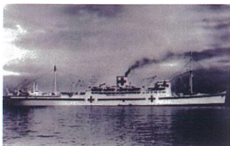
終戦直後の氷川丸

そこで社会事業団体の幾つかが共同で、金沢区野島周辺の空き家となった元海軍兵舎を利用して引揚者の支援にあたったのです。母子・女性棟、男子棟にわかれ生活しましたが、食料も少なく平潟湾のアサリや海藻は食べつくされたと聞きます。