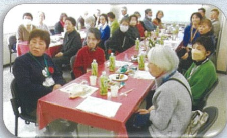
参加された皆さん