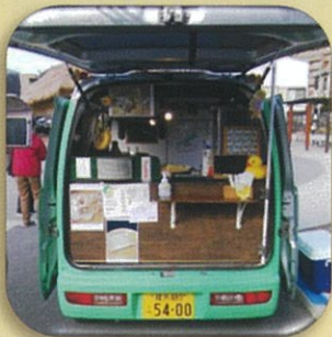
キッチンカーにより 好きなクレープメニューを手渡し配食