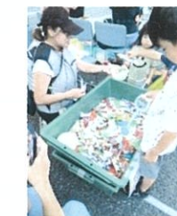
宮花宿三・四丁目