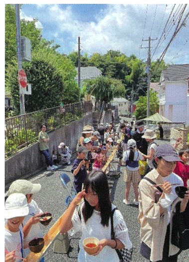
六ツ川中第二自治会