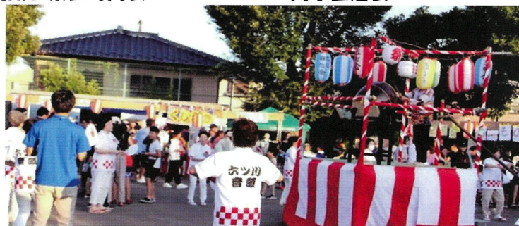
三金、高嶺、旭ヶ丘合同夏まつり