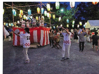
別所若葉台町内会

この夏は本当に暑い夏でしたが、六ツ川連合内のいくつかの自治会町内会では夏まつりが開催されました。夏の風物詩でもある盆踊りや、流しそうめん、おみこし、模擬店と様々な催しが行われました。