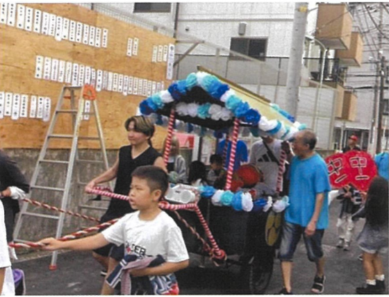
東台・ヒルズガーデンア共催のハロウィンイベント 10月25日