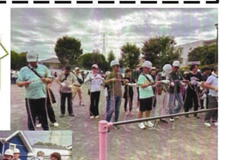
ロープ結索訓練の様子