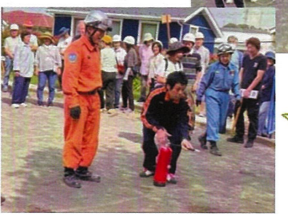
水消火器訓練の様子