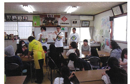
<子どもオーラルケアボランティア>

地区社協と連携して定例会やサロン、子ども映画会、ミニ集会、地域の行事においては委員相互の関係と関係機関からの情報に加え全員の意思疎通を図るように努めています。さらに健民祭やみんなの音楽祭等の行事では、地域の身近な相談相手見守り役として活動しています。見守りを通して把握した高齢者の地域行事へのお誘い、自治会町内会と連携し災害に備えて高齢者や障害のある方などが参加する防災訓練に協力しています。また、委員相互の親睦を図り子ども食堂などの居場所づくりをサポートしながら地域の中で子どもたちが元気に過ごせるように見守りをおこなっています。子育て世帯や障害のある方、福祉に関する様々な相談に応じて区役所や地域ケアプラザ、区社協につなぐ役割を担っています。