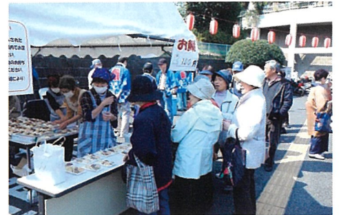
<ケアプラザ交流会>

日常生活のなかで困りごとへの直接的な支援は、本来の役目ではありませんが一人ひとりが担当区域の見守り対象のすべての困りごとに対応することは不可能です。しかし無理なく継続できる支援の仕組みを考え、見守り者の日常生活を知る民生委員・友愛推進員・保健活動推進員が連携をとり、地域の人の困りごとを守秘義務を守りながら行政につなぐ役割をしています。