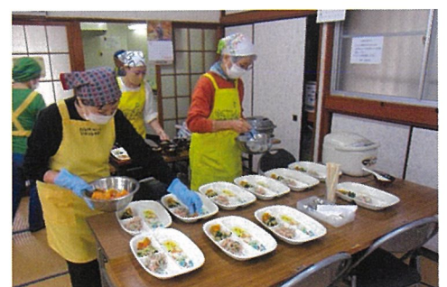
<子ども食堂ボランティア活動>