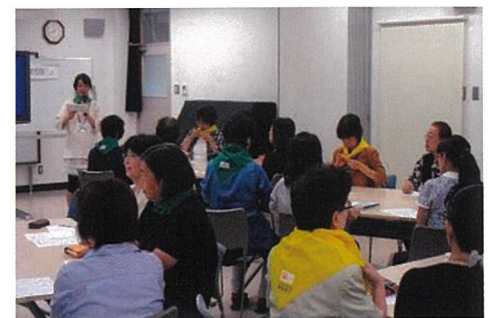
<障がい者対応研修会>

昔からの知り合いである隣同士であっても一週間以上顔を合わせることがないといった話を聞くことがあります。自治会町内会単位で組み込まれているサロン活動は、希薄化する関係をつなぎ直すとともに、困りごとを抱えている人の発見や見守りに重要な役割を担っています。閉じこもりがちな高齢者をサロンに誘い、「食」の提供をしながら和やかな雰囲気の中で悩みを相談し、見守りをする関係が生まれる場所づくりをしています。