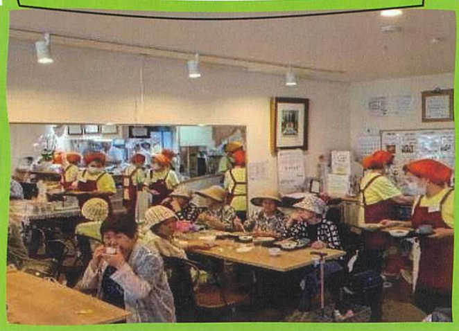
サロンほっとサライ