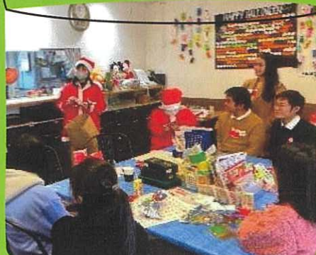
子どもの居場所 SUN SUN