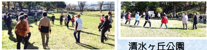
清水ヶ丘公園 近隣の皆さんどなたでも参加できます