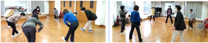
清水ヶ丘ケアプラザさんによるストレッチ運動 地域の皆さん対象