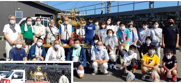
「言い訳ですが、神輿は 担いでいません」とのこと