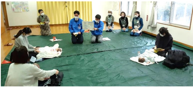
南区役所と太田地区保健活動推進員さんによる 近隣の親子対象 (第1子まで)