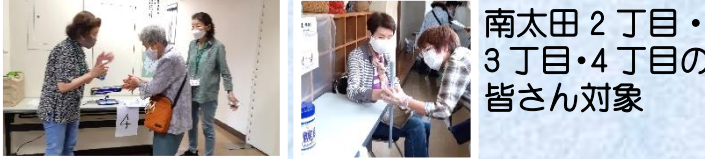
保健活動推進員と一緒に体力測定を兼ねた配食