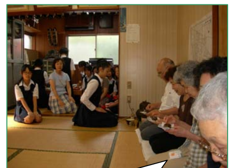
お点前、頂戴いたしま